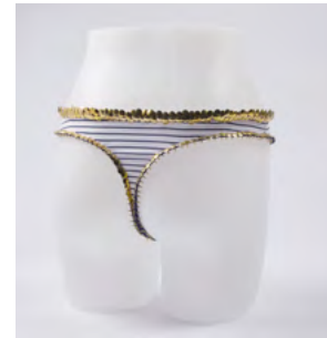
Maximilien Ramoul - Culotte de chasteté