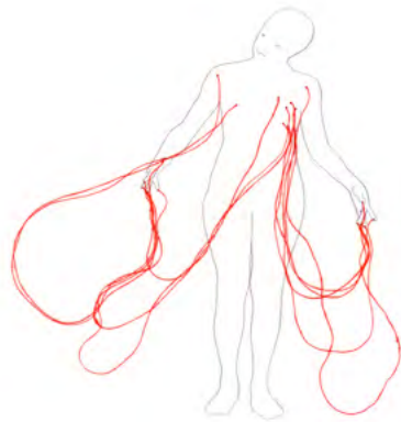
Pauline Cornu - Veines