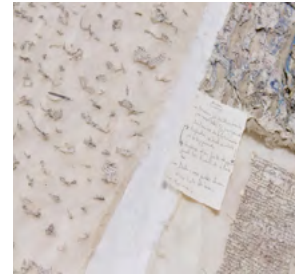
Dolores Gossye - Ecorce