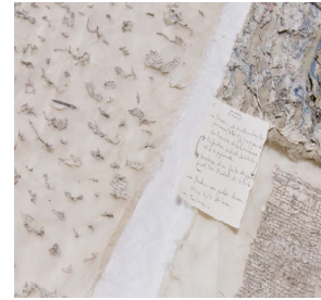
Dolores Gossye - Ecorce