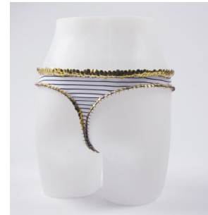
Maximilien Ramoul - Culoire de chasteté