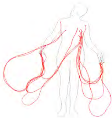
Pauline Cornu - Veines