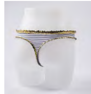
Maximilien Ramoul - Culotte de chasteté