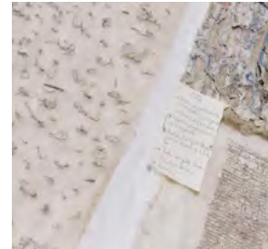
Dolores Gossye - Ecorce