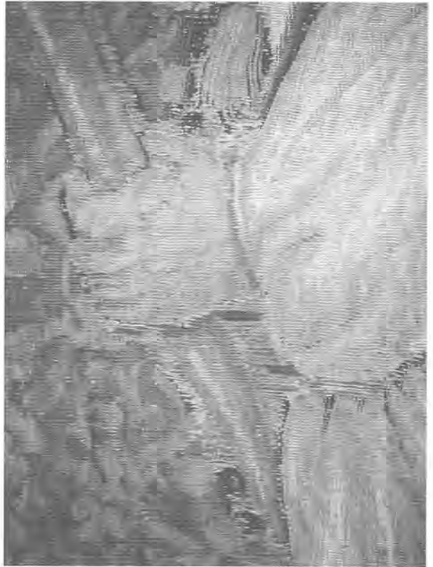
3. Détail identique après consolidation. Chaînes dénudées retendues sur un lin de couleur.

In overleg met de conservator van de schatkamer van de kathedraal werd overeengekomen dat de behandeling, uit respect voor het origineel, eerder een conservatie dan een restauratie moest zijn.