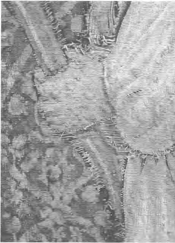
2. Détail avant consolidation. Chaînes dénudées maintenues par des points visibles cousus sur l'ancienne doublure.

En concertation avec le conservateur du Trésor de la cathédrale, il s'est avéré que, par respect pour l'original, le traitement de la tapisserie serait une conservation plutôt qu'une restauration.