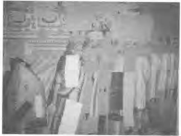
4. Arrière de la tapisserie consolidée.

Omdat we niet weten of er oorspronkelijk boorden waren, werd besloten de zijranden om te plooiën op een manier die zo weinig mogelijk origineel verborgen. Vervolgens bestond de conservatiebehandeling uit het fixeren van stukken linnen aan de achterzijde van het weefsel om zo de zwakke plekken te consolideren. Het betreft hier oude restauraties, blootliggende of gebroken kettingdraden. De keuze van de kleur van het linnen hangt af van de tint van de te consolideren zones. Bij de consolidatie van elk oud textiel moet men er voor zorgen dat de nieuwe materialen de oude niet beschadigen. Daarom gebruikt men zwakkere garens dan de oude vezels. Zo zullen, in geval van spanningen, de nieuwe draden breken. We gebruiken dus zijde, die ook al aanwezig is in het originele weefsel en waarvan de kleur gekozen is volgens de te conserveren oppervlakken. Deze conservatiemethode is reversibel.