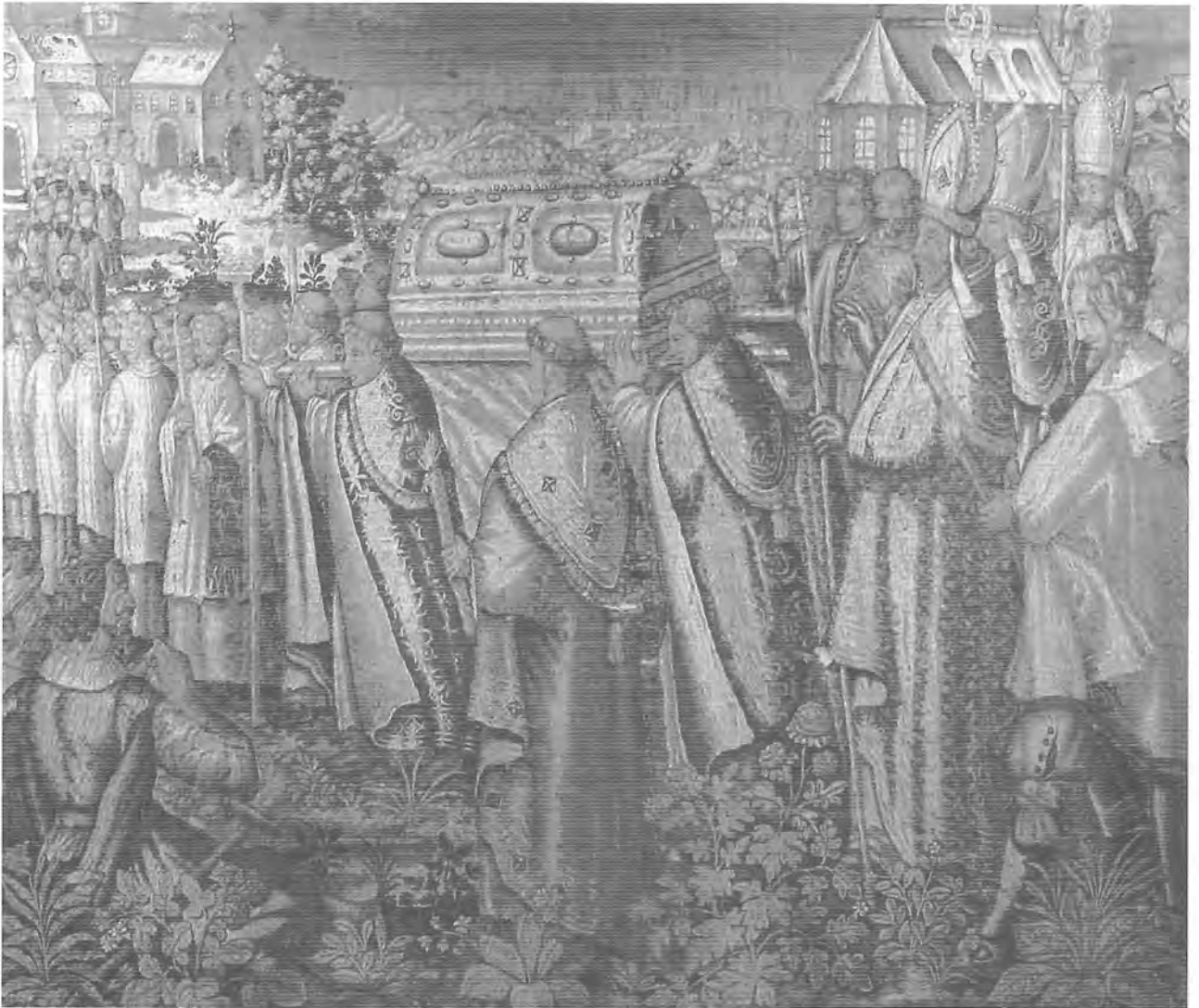
1. Vue d'ensemble / 1. Algemeen beeld

Citée pour la première fois en 1884, la tapisserie est conservée depuis 1924 au Trésor de la cathédrale Notre-Dame de Tournai. Dépourvue de bordure, de marque de ville licière ou d'atelier, elle est cependant peu documentée.