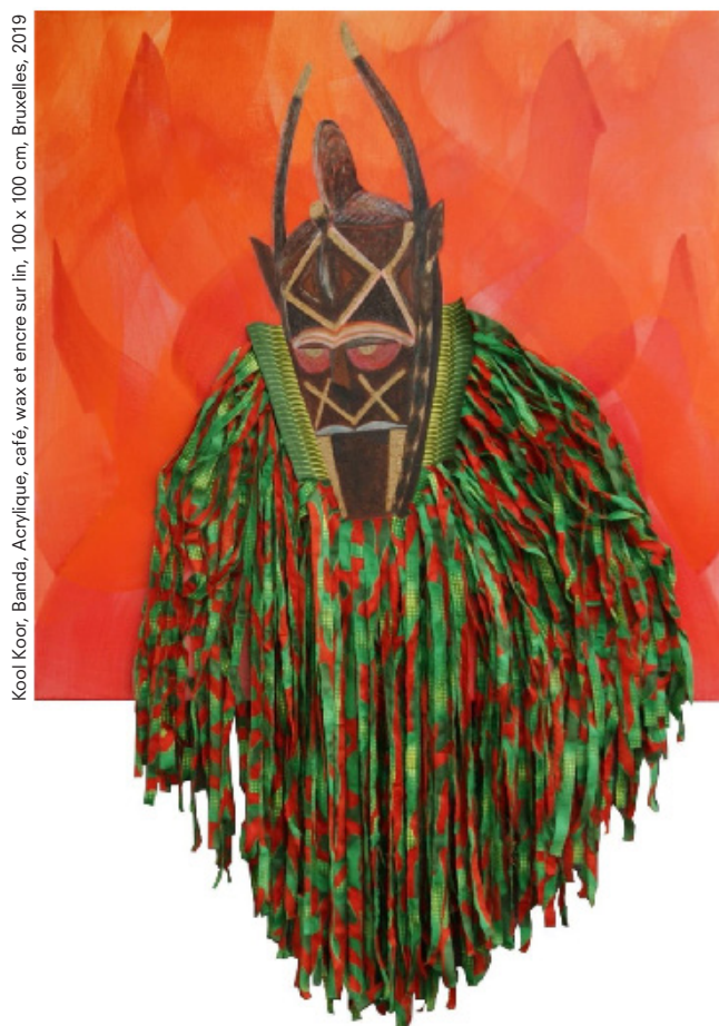
Kool Koor, Banda, Acrylique, café, wax et encre sur lin, 100 x 100 cm, Bruxelles, 2019