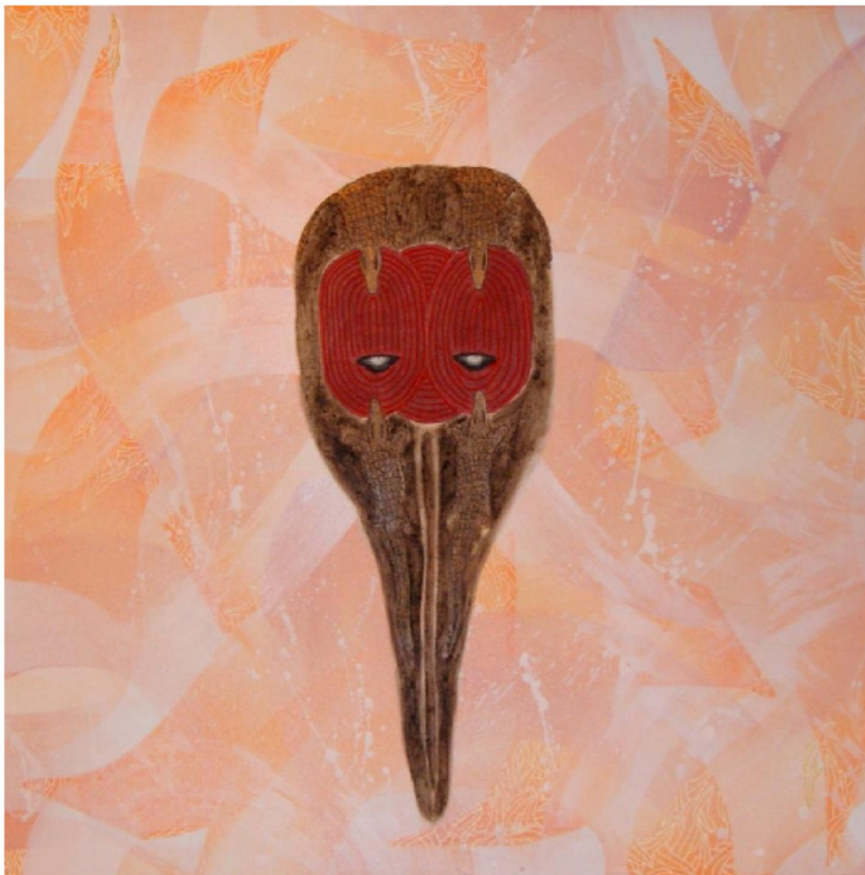
Kool Koor, Elek , Acrylique, café et encre sur lin, 100 x 100 cm, Bruxelles, 2019

Il est intéressant de signaler que l'artiste est récemment parti en quête de ses origines, établies en Guinée. Les œuvres conçues dans le cadre du projet Wax Masters sont donc particulièrement lourdes de sens pour cet homme issu de la diaspora africaine.