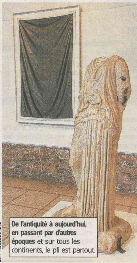
De l'antiquité à aujourd'hui, en passant par d'autres époques et sur tous les continents, le pli est partout.

De A à Z, l'alphabet lui offre vingt-six thèmes ou approches possibles : Arts de la table, Bazin de Bamako (son « péché » mignon), Coquettes, Drapé, Exercices, Fraises, Garde-robe... Jupes, Kimo-